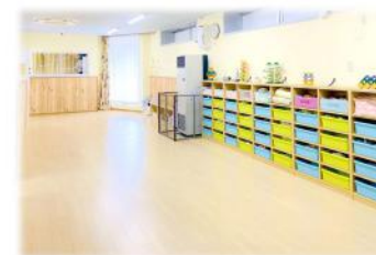
ほふく室 / 保育室