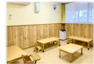
保育室 / ランチルーム