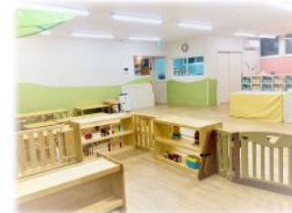
△保育室 / ほふく室